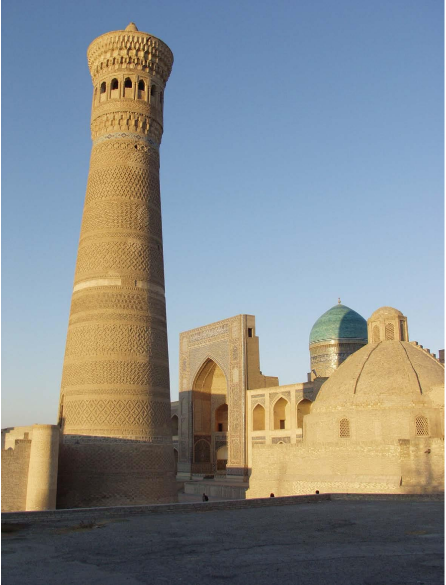
历史名城——布哈拉古迹