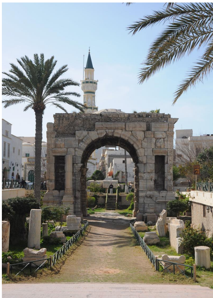
的黎波里市中心古城清真寺

2016年3月13日，利比亚空中交通管制人员罢工，影响首都的黎波里及其他都会机场多架航班。