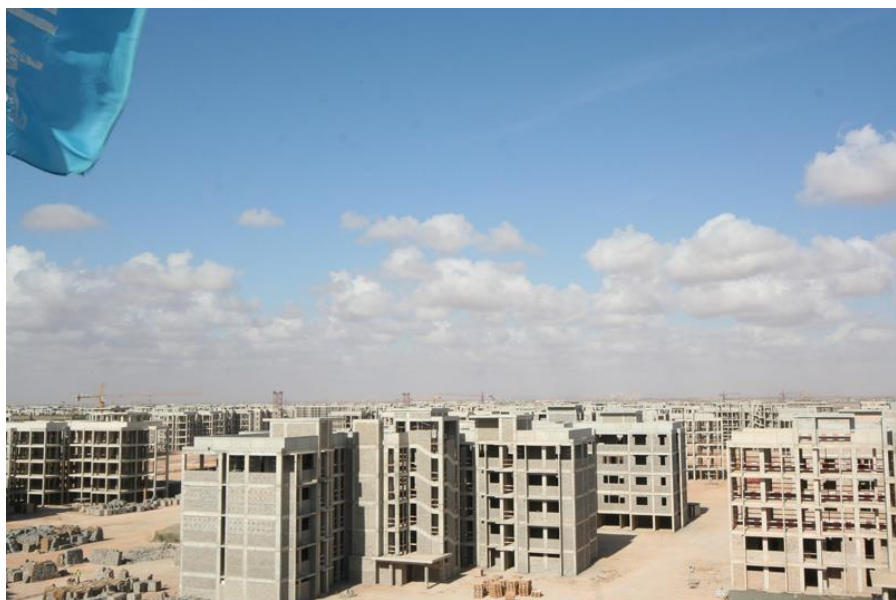
中建利比亚班加西富德15000套住宅工程施工现场