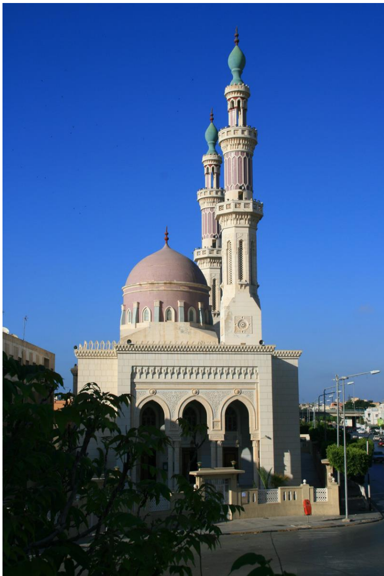
利比亚穆罕默德清真寺

时间表安排约束。利比亚烹饪融合了阿拉伯和地中海的烹饪风格，并深受意大利菜肴影响。但目前社会安全局势不稳，有少数青年饮酒吸毒。