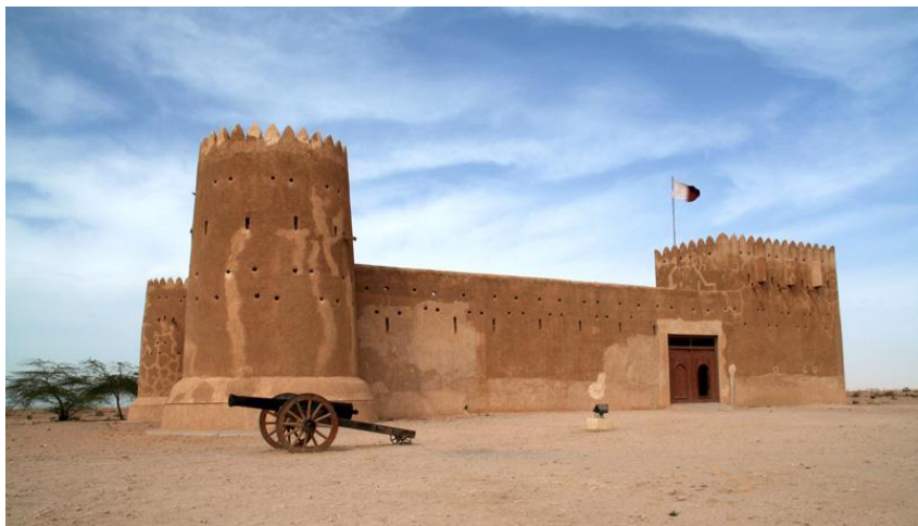
卡塔尔祖巴拉城堡

公元7世纪时，卡塔尔是阿拉伯帝国的一部分。1517-1776年间，先后受葡萄牙、荷兰和英国统治。1846年萨尼·本·穆罕默德建立了卡塔尔酋长国。1872年并入奥斯曼帝国版图。1882年英国入侵，并宣布该地区为英国的“保护地”。1970年颁布的第一部临时宪法规定卡塔尔为独立的君主制主权国家，伊斯兰教为国教。1971年9月3日，卡塔尔正式宣布独立，艾哈迈德任埃米尔。1972年2月22日，艾哈迈德堂弟哈利法出任埃米尔，哈利法之子哈马德任王储兼国防大臣。1995年6月27日，哈马德出任埃米尔。2013年6月25日，哈马德埃米尔让位于王储塔米姆。