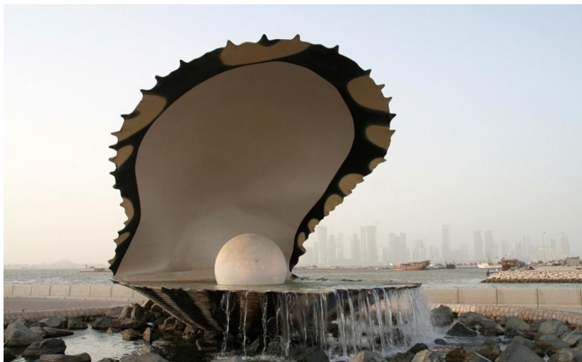
多哈标志之一——珍珠雕塑