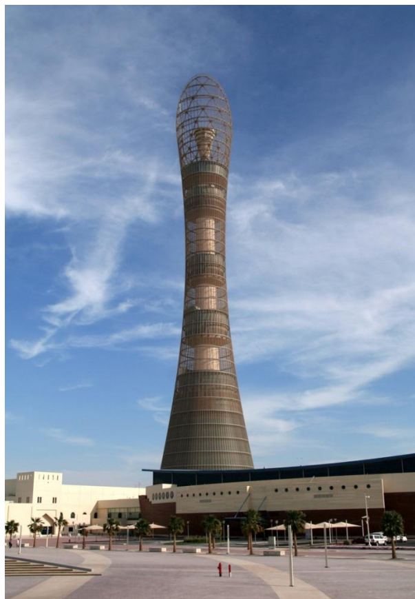
多哈亚运会火炬塔