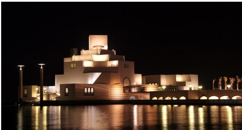
多哈伊斯兰艺术博物馆夜景

卡塔尔全国共设7个市政区。首都多哈市（Doha）是全国政治、经济和文化中心。北部的拉斯拉凡市和南部的梅赛义德市是卡塔尔以石油化工和天然气液化为主的工业城市。